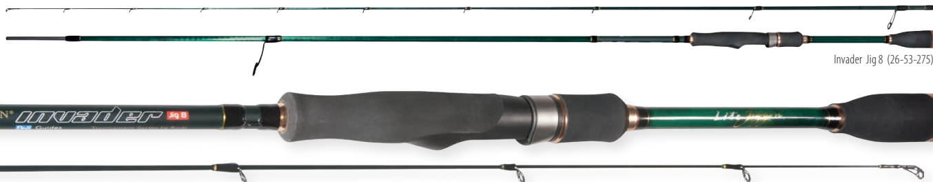
Invader Jig 8 (26-53-275)