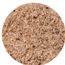
Klej Super Mocny