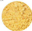
Pieczywo Fluo Żółte

KLEJ SUPER MOCNY (00-10-31-05-1000) – składnik wiążący o słodkim smaku i aromacie. Przeznaczony na rzeki o średnim i silnym uciążu. Bogaty w cukry i proteiny. Zastosowanie: 10 – 40% całkowitej masy zanęty. Opakowanie: 450g.